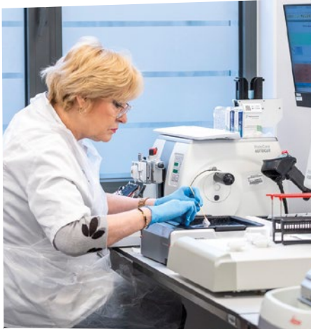
Nowo otwarty Zakład Patomorfologii Klinicznej w WSZ w Toruniu to obecnie ośrodek z najnowocześniejszym tego typu sprzętem w regionie.