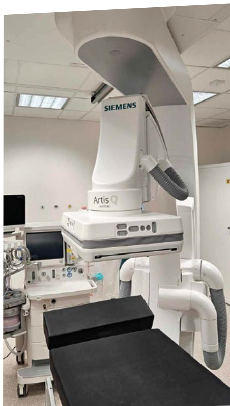
Zespół Pracowni Interwencji Sercowo-Naczyniowych w szpitalu we Włocławku wybudowano i doposażono za kwotę 15 mln zł, działa od końca marca br.