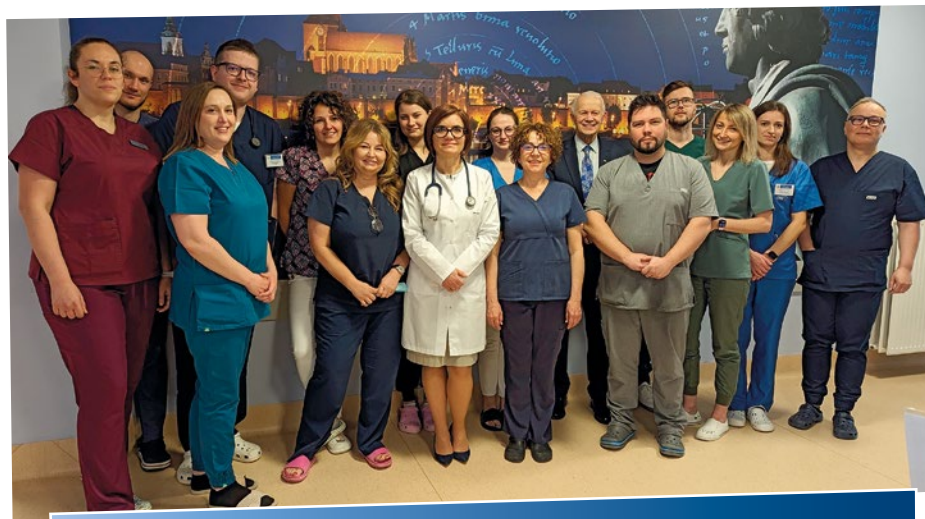
Zespół Oddziału Hematologii i Transplantacji Szpiku Specjalistycznego Szpitala Miejskiego w Toruniu.

Według szacunków władz placówki tylko w tym roku szpitalny zespół planuje wykonanie minimum 150 zabiegów z asystą robota. Ponadto planowane przez NFZ refundacje kolejnych zabiegów robotycznych (operacje z powodu raka nerki i raka pęcherza moczowego), oraz zabiegów chirurgicznych przełoży się na jeszcze większe wykorzystanie robota. – Oczywiście jest, iż wkrótce współczesne leczenie zabiegowe (w jakiegokolwiek dziedziny medycyny zabiegowej) nie będzie możliwe bez użycia robota operacyjnego – zwraca uwagę rzecznik.