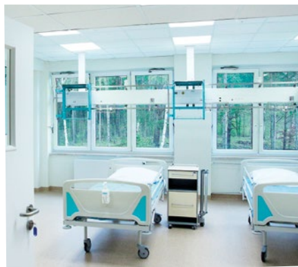
Tak prezentuje się blok pediatryczny szpitala w Grudziądzu po metamorfozie.