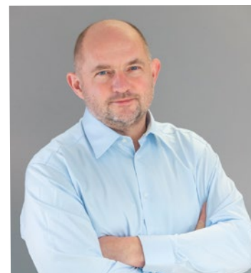
Piotr Całbecki.

– Inwestycje w placówkach publicznego lecznictwa, przede wszystkim w szpitalach, od lat pozostają priorytetem zarządu województwa. Ponieważ w medycynie nie ma zakończonych projektów, kontynuujemy nasz wielki wojewódzki program modernizacji lecznic. Szpitale, zwłaszcza te najważniejsze w regionie, muszą być stale modernizowane, co oznacza zakupy sprzętu i aparatury medycznej najnowszej generacji, a także rozbudowę szpitalnych kompleksów. Nasze obecne plany obejmują przede wszystkim budowę centrum diagnostyki obrazowej w bydgoskim Wojewódzkim Szpitalu Dziecięcym, dokończenie inwestycji w Wojewódzkim Szpitalu Zespolonym w Toruniu, rozbudowę i modernizację głównej części kompleksu regionalnego Centrum Onkologii oraz dokończenie rozbudowy Szpitala Wojewódzkiego we Włocławku – podkreśla marszałek.