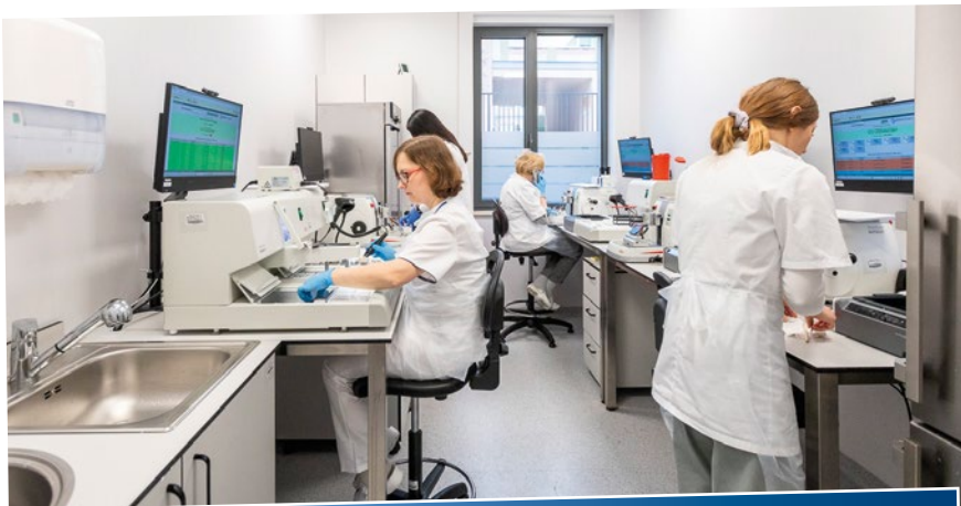
Dzięki w pełni zautomatyzowanej linii diagnostycznej możliwe jest maksymalne skrócenie czasu od pobrania materiału do postawienia rozpoznania. Zakład składa się z pięciu jednostek – pracowni histopatologii, cytologii, histochemii, immunohistochemii i sekcyjnej.