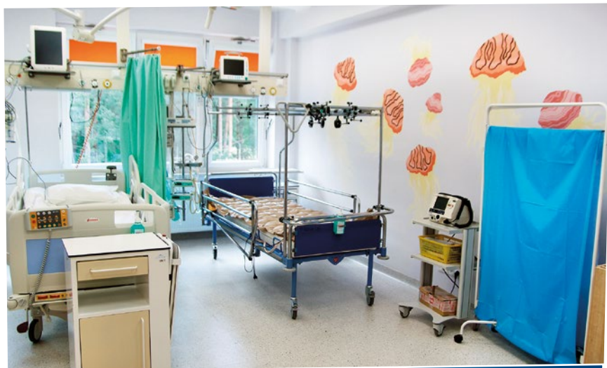
Nowe, kolorowe wnętrza bloku pediatrycznego szpitala w Grudziądzu.